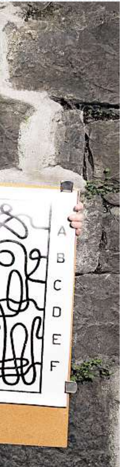
les aptitudes des mauvais conducteurs.