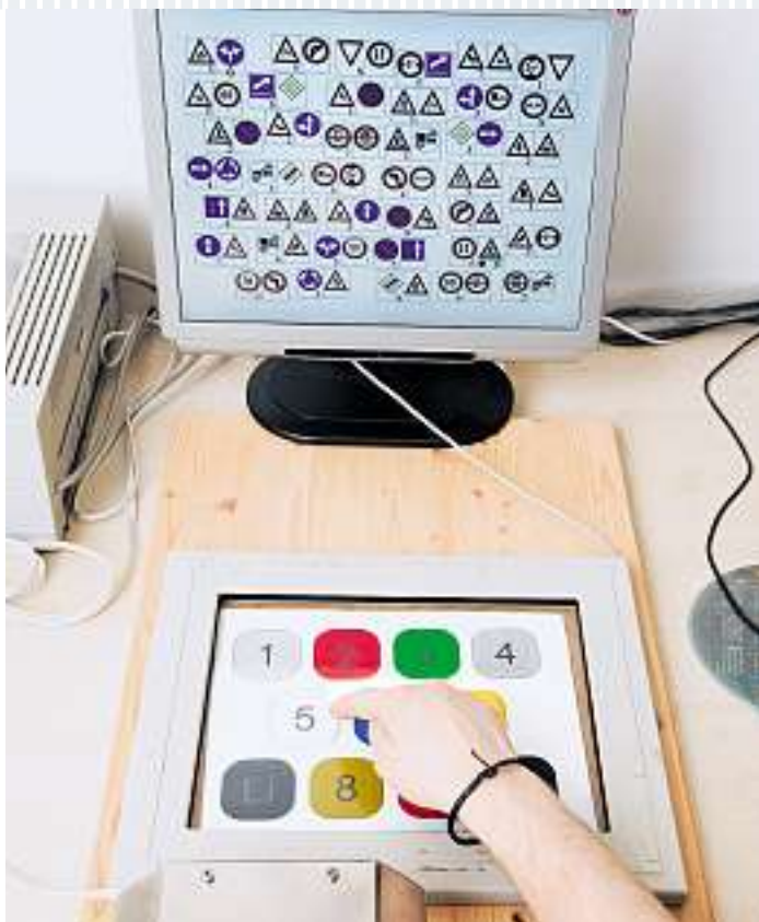
Selon les spécialistes, punir les chauffards ne constitue pas une solution suffisante. Il s'agit également de les soigner.