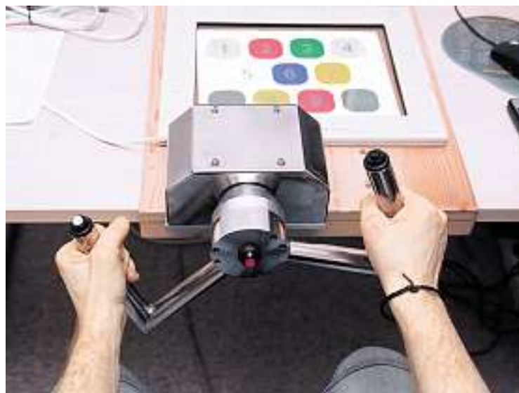
A l'institut pour la prévention des accidents de la route, les chauffards doivent effectuer des exercices de simulation routière.

Le patron de l'IPAR se montre plutôt d'accord avec Andreas Widmer. Interrogé par le journal du TCS, le président de la Société suisse de psychologie de la circulation y estime que seule une thérapie peut guérir cette poignée de têtes brûlées. Dans son rapport, il propose souvent d'astreindre ce type de profil psychologique à une «thérapie du trafic». La mesure diffère